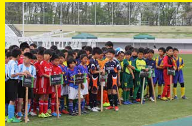
5月にはU-11JCカップ少年少女サッカーフェスティバルを設け、参加者の笑顔にあふれた。

我々の担当する事業は、他の委員会の皆様のご協力なくしては決して成立しません。委員会スローガンは「事業は楽しく、屁は臭く」。委員会の枠に囚われず“持ちつ持たれつ”で活動してまいりますので、皆様どうぞ宜しくお願い致します。鬼っジョブ～～!!