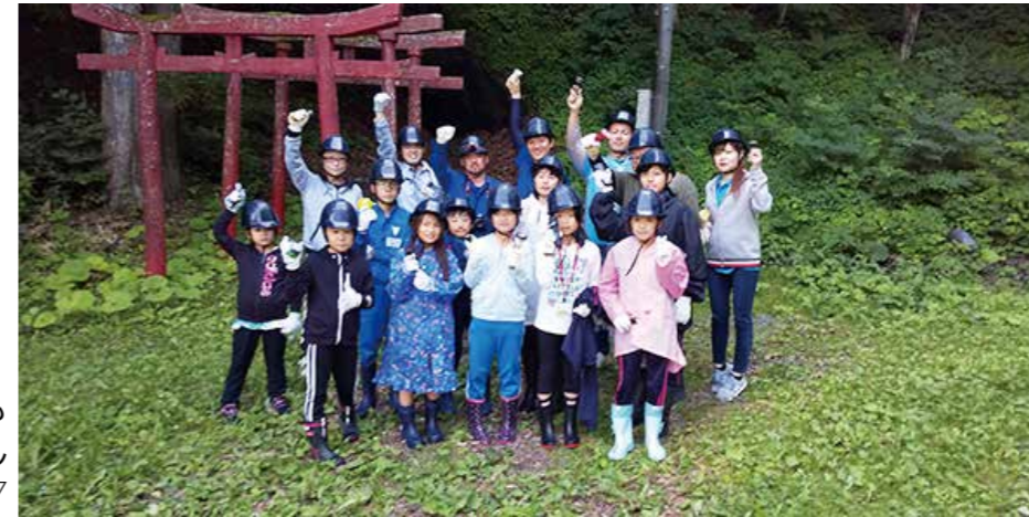
◁洞窟探検に向かうみんな